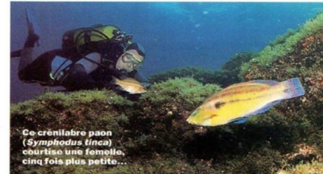
Ce crénilabre paon ( Symphodus tinca ) courtise une femelle, cinq fois plus petite...

l'entrée de l'Arche. Nous nous engageons dans un tunnel triangulaire tapissé d'éponges multicolores et de corail solitaire jaune. Des pépites d'or incrustées dans la roche sont révélées par l'éclat de nos phares. Nous débouchons de l'autre côté, dans un dédale de blocs, où évoluent d'impressionnants bancs de sars. Un peu plus loin, dans les anfractuosités, des branches de corail exposent leurs polypes cotonneux. L'or rouge de Méditerranée à vingt-deux mètres de profondeur seulement ! L'exploration se poursuit, en survolant un canyon drapé d'éventails pourpres de toute beauté. Puis vers trente mètres, deux pics rocheux apparaissent. Accrochés aux parois, des dizaines de bouquets spiralés balancent leurs panaches de plumes. Des spirographes géants, blancs, jaunes, rayés, pas farouches du tout, se laissent admirer et photographier à souhait. Ces explosions de couleurs imprègnent nos rétines comme autant de feux d'artifice. A bord du Ketos , l'ambiance est conviviale, et l'apéro, une tradi-