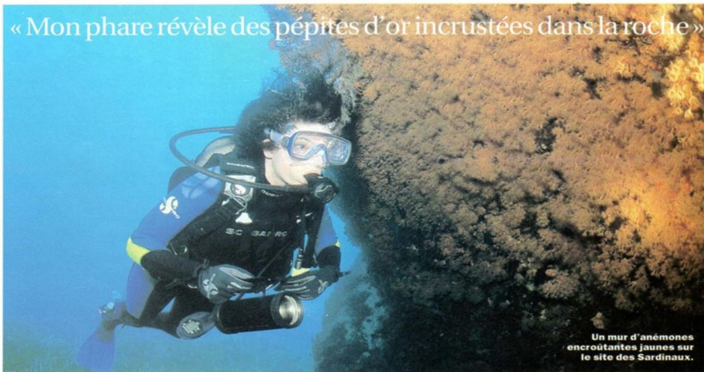
« Mon phare révèle des pépites d'or incrustées dans la roche »