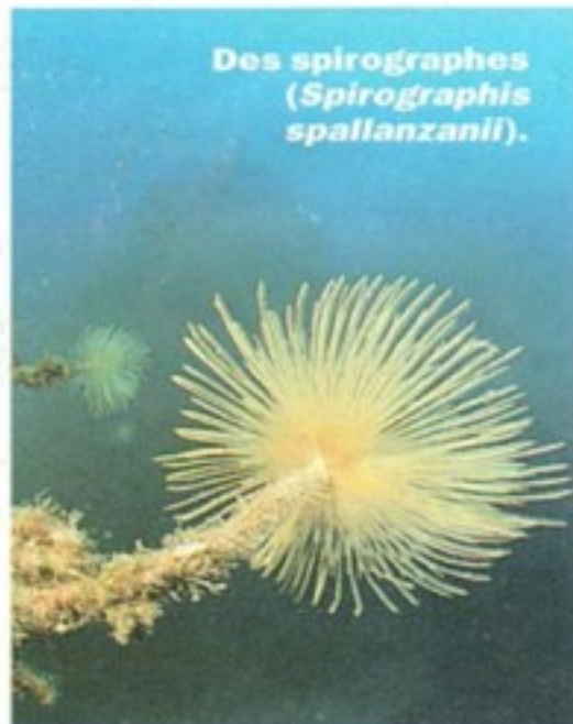
Des spirographes ( Spirographis spallanzanii ).